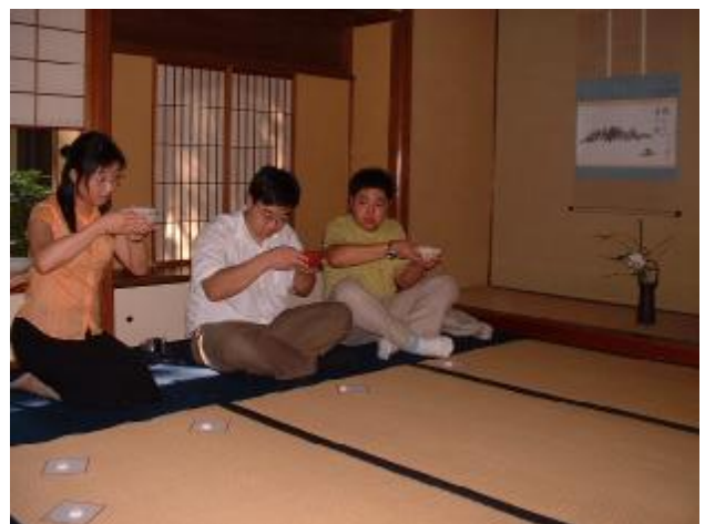
ようこそ堺へおこしくございました！ こんな座り方でお許しください！ お手前頂戴いたします。