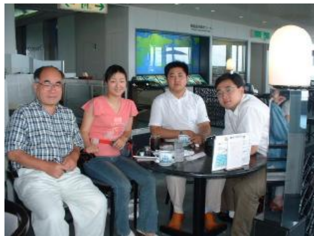
「堺」の由来は理解、「方除け」＝「風水」？説明に四苦八苦！「We must say good by！」「再見！」