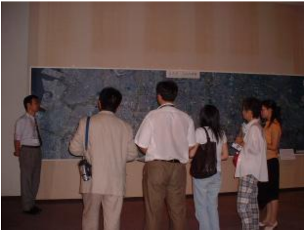
池峯学芸員による堺の歴史・文化説明