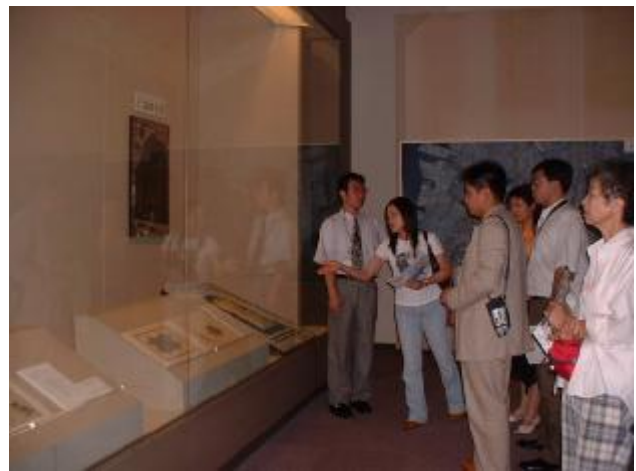
桂紅花さん（「堺学Ⅰ」単位取得済み）による通訳