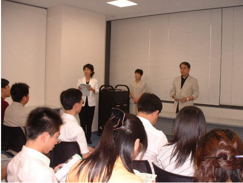
歓迎式 2004年7月10日午後1時40分 堺市役所本館3回大会議室3 研修生一行 通訳 西尾課長 溝口部長 堺市・国際担当 堺市・国際文化観光部