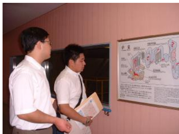
燃焼路炉構造、メカニズムの解説 (英語スピーチ解説)