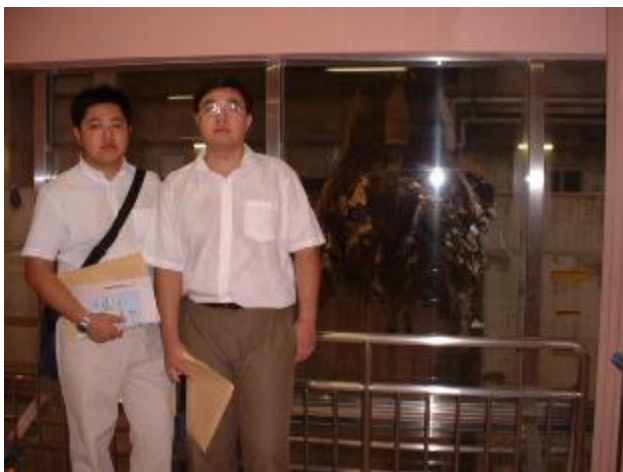
ごみピット全自動クレーン前