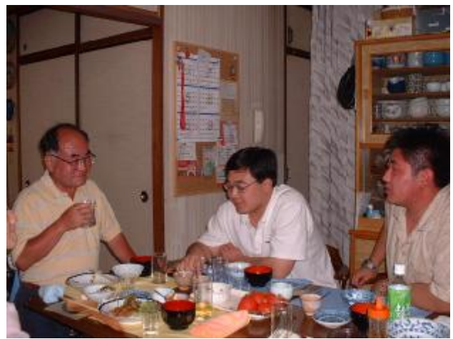
夕食懇談（幅広く、奥行きも深め、午後 10 時 30 分まで桂さんの通訳を入れて懇談）